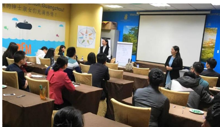
图 9：13 级酒店管理专业实习生