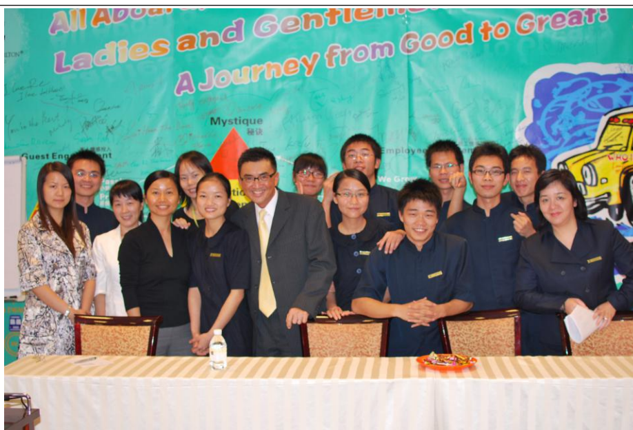
图 7：08 级酒店管理专业顶岗实习生