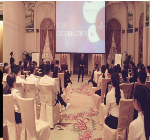
图 6: 酒店管理专业学生到广州富力丽思卡尔顿酒店参观受到酒店热情接待

2. 广州富力丽思卡尔顿酒店酒店管理专业校外实践基地是酒店管理专业学生专业实习(春交会、秋交会实习)、顶岗实习的最佳选择。