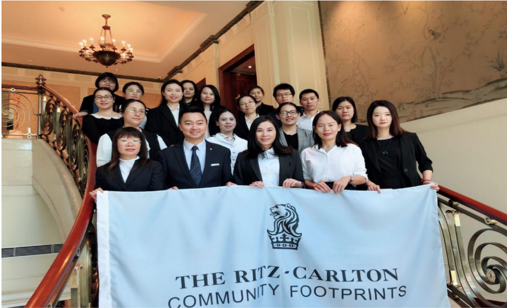
图 16：由酒店管理专业主办的师资培训（国培）项目学员在广州富力丽思卡尔顿酒店交流

酒店管理专业主办省级师资培训项目，广州富力丽思卡尔顿酒店作为基地承担企业交流部分的培训任务。