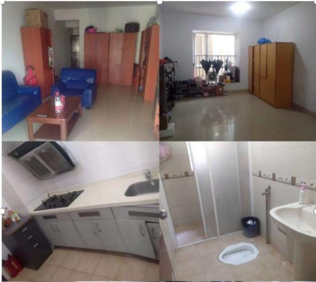
图 1：广州富力丽思卡尔顿酒店员工宿舍

(二) 基地为实习生提供设施齐全的员工宿舍套房，配有专门的宿舍管理人员；给实习生提供良好的岗前培训，包括安全操作培训、消防培训，给实习生配备必要的劳动保护用品，如手套等，不安排实习生到危险的岗位，并为所有实习生购买保险，确保实习生和员工得到相同的保障。