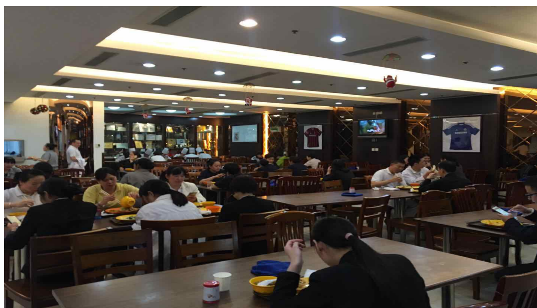
图4：广州富力丽思卡尔顿酒店员工自助餐厅

广轻酒店管理专业的学生们也被丽思卡尔顿酒店所吸引，每年的广交会实习、顶岗实习，丽思卡尔顿酒店都是作为第一家到学校面试的企业，吸引最多的学生面试，从2008年合作至今，每年至少有50名学生到丽思卡尔顿酒店实习，学校与丽思卡尔顿酒店实习签订合法有效的合作协议。学生毕业后留在酒店发展的比例也高达60%以上。留在广州富力丽思卡尔顿酒店的学生获得极好的职业成长机会，目前已经有广轻酒店管理毕业生在丽思卡尔顿酒店成长为经理、主管。