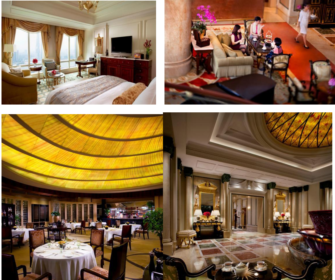
图 3：酒店内部设施（客房、大堂、餐厅）

广州富力丽思卡尔顿酒店楼高 40 层，拥有 351 间客房及 91 套豪华公寓，一楼至四楼群楼是餐饮及休闲空间。酒店临近珠江，毗邻广东博物馆新馆和广州歌剧院，与广交会新馆隔江相望，酒店西北侧是未来广州的地标双子塔。广州富力丽思卡尔顿酒店因为其品牌号召力及一流的服务在行业内口碑极佳，受到世界各地客人的追捧，其客房出租率及平均房价在广州市的五星级酒店中均名列前茅。丽思卡尔顿酒店获得服务业和权威消费者组织颁发的所有主要大奖：是第一个并且是唯一一个曾两次获得美国国家质量奖的酒店集团（服务行业的最高质量奖项）并多次获得 AAA 五星钻石奖。