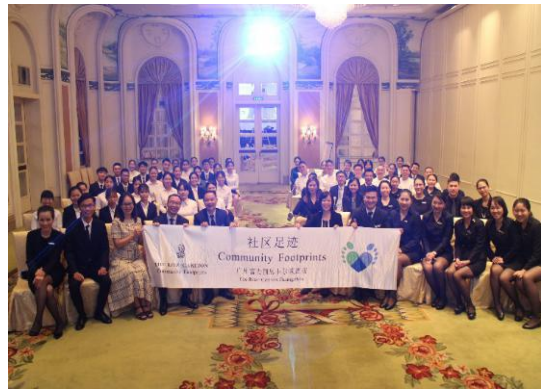
如图 17：广州富力丽思卡尔顿酒店员工与酒店管理专业学生一起参加社区服务