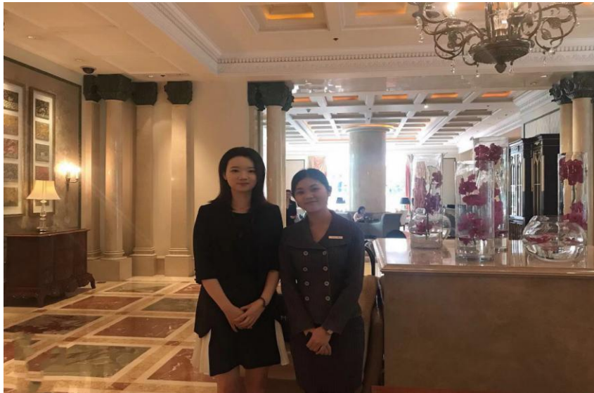
图 10：15 级酒店管理专业实习生