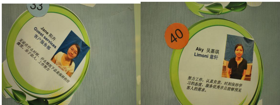
图 20：广轻酒店管理专业丽思卡尔顿酒店优秀实习生上光荣榜