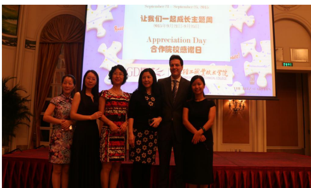
图 19：广州富力丽思卡尔顿酒店、广东轻工职业技术学院“最佳合作院校”颁奖典礼