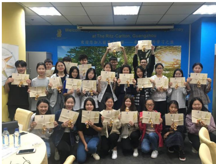
图 11：17 级酒店管理专业实习生

3. 广州富力丽思卡尔顿酒店参加酒店管理专业人才培养方案的制定, 优化了酒店管理的专业课程设置、实践教学安排。