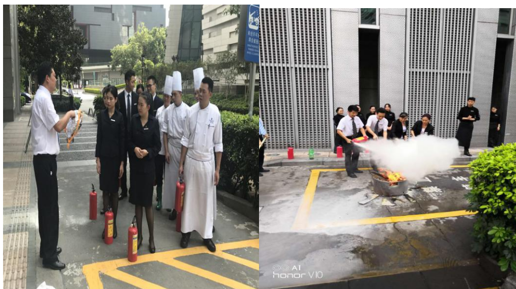
图 2：酒店举行消防演习（培训）

（三）基地组织机构健全，教学运行、学生管理、安全保障等管理制度完善，实践教学管理规范，保护学生合法权益。