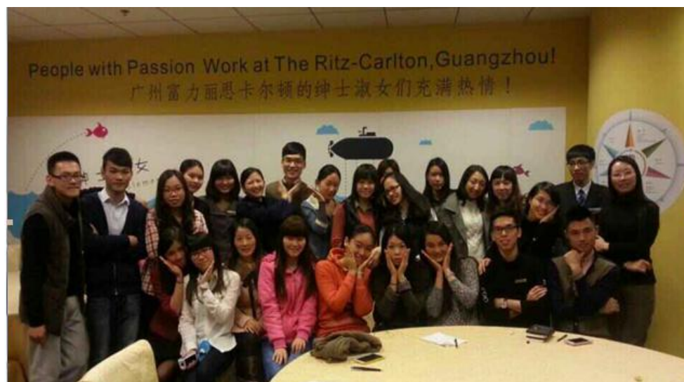
图 8：11 级酒店管理专业顶岗实习生